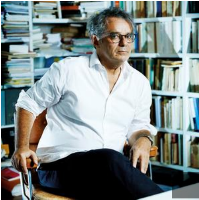
Jean-François Braunstein

mais ce n'est pas toujours le cas. Cette notion de genre sera popularisée en 1972 par Money dans son livre le plus célèbre, écrit avec la psychologue et sexologue Anke Ehrhardt, Un homme et une femme. Un garçon et une fille .